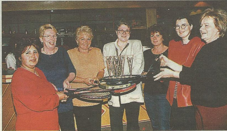
Bei der Siegerehrung gab's ein Glaserl Sekt...

„Es war ein sehr ausgeglichenes Turnier, durch die knappen