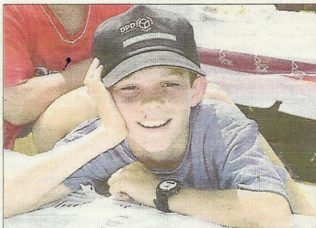
Links: Belustigt verfolgt der junge Mann das samstägige Geschehen im Grafenwörther Pfarrgarten.